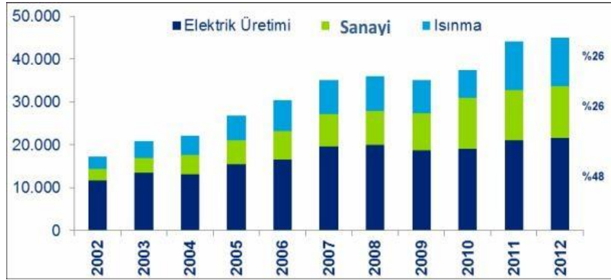
Grafik 1: Türkiye'nin Doğal Gaz Tüketiminin Yıllara Göre Sektörel Dağılımı (milyon m 3 )